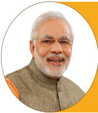
श्री नरेंद्र मोदी भारत के प्रधानमंत्री