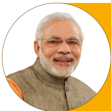
श्री नरेंद्र मोदी भारत के प्रधानमंत्री