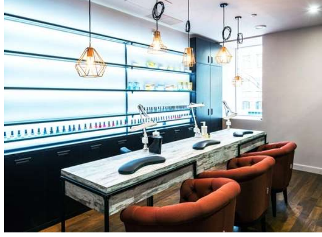
படம் 2.2 நக அழகு பராமரிப்பு நிலையம்