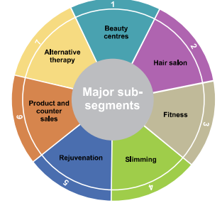
படம் 1.5 அழகு மற்றும் உடல் நலம் பேணல் துறையின் வகைப்பாடு

சர்வதேச அழகு சாதனத் தயாரிப்புகள் - வளர்ந்து வரும் வாடிக்கையாளர் எண்ணிக்கை, சர்வதேச முத்திரை பெற்ற அழகு சாதனத் தயாரிப்பாளர்கள், இந்திய சந்தையில் நுழைவதற்கு முயற்சிகளில் ஈடுபடக் காரணமாய் இருக்கிறது.