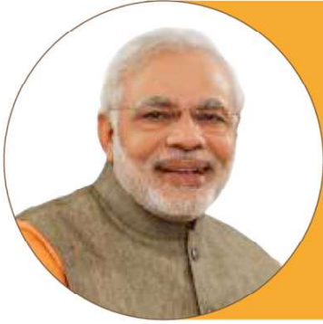
ஸ்ரீ நரேந்திர மோடி இந்தியாவின் பிரதம மந்திரி

“தொழில் திறன்களே இந்தியாவிற்கு முன்னேற்றம். இந்தியாவை வளர்ச்சிப் பாதையில் செலுத்தவேண்டும் என்றால், தொழில் திறன்களை வளர்ப்பதே நமது குறிக்கோளாக இருக்கவேண்டும்.”