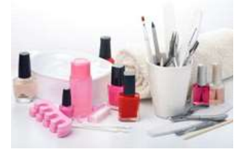
படம் 1.3 உதவி நக அழகுத் திறனாளர் பயன்படுத்தும் கருவிகளும், உபகரணங்களும்