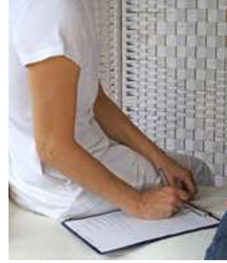
படம் 2.1 வாடிக்கையாளரின் விவரக் குறிப்பு அட்டையை நிரப்புவதல்