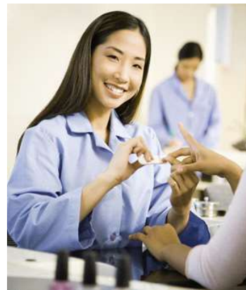
படம் 1.1 உதவி நக அழகுத் திறனாளர்

அழகுக் கலை மற்றும் உடல் நலம் பேணும் துறையில் ஏற்பட்டுள்ள வேகமான வளர்ச்சியுடன், ஏற்கெனவே நன்கு வளர்ந்து, ஒழுங்கமைவுடன் இயங்கும் தேசிய மற்றும் உலக அளவிலான பெரு நிறுவனங்கள் உள்ளே வந்ததால், மிக நன்கு பயிற்சி பெற்ற அழகுக் கலைஞர்களின் தேவை அதிகரித்தது. அதே சமயம், எந்த அளவுக்குத் தேவையோ, அந்த எண்ணிக்கையில் பயிற்சி பெற்றவர்கள் இல்லை. இந்தத் திறன் மிகு பணியாளர் குறைபாடு, இத்துறை வேகமாக வளர்வதற்குத் தடையாக உள்ளது. ஆகவே இத்துறையில் திறமை வளர்த்தல் மற்றும் பயிற்சி என்பது தொழில் ரீதியாகவும், துறைக்குமே மிகப் பெரிய சவாலாக இருக்கிறது.